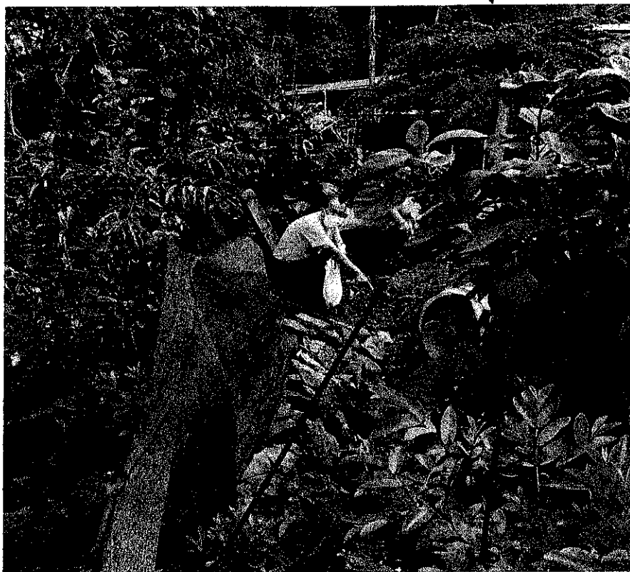
บริเวณบ้านนายหลวง แสงสว่าง บิดานายอำนาจ แสงสว่าง ผู้ร้องเรียน จุดที่น้ำจากท่อ ระบายน้ำไหลเข้าบ้าน